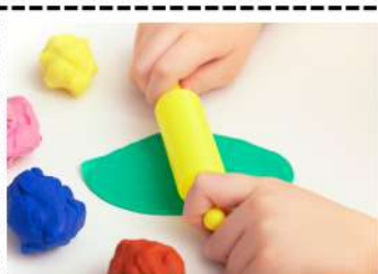
Faire de la pâte à modeler