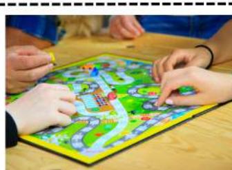
Jouer à un jeu de société