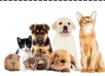
Jouer avec mon animal..