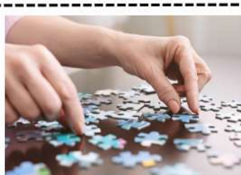
Faire un casse-tête