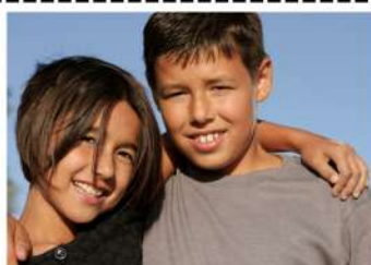
Jouer avec mon frère ou ma soeur.