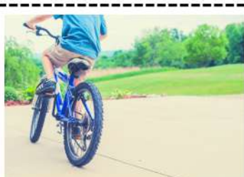
Faire du vélo.