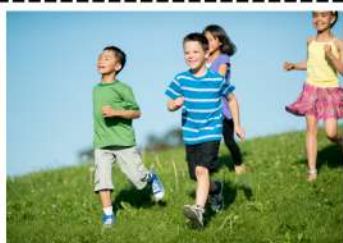
Jouer avec mes amis.