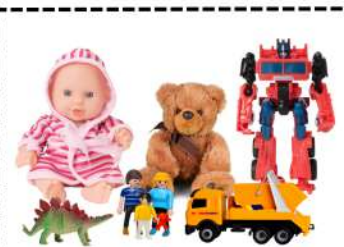
Jouer avec mes jouets