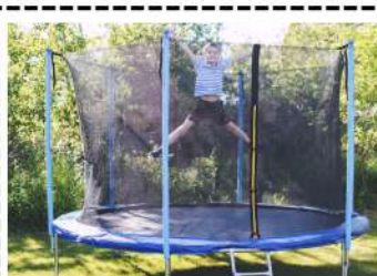
Sauter sur le trampoline.