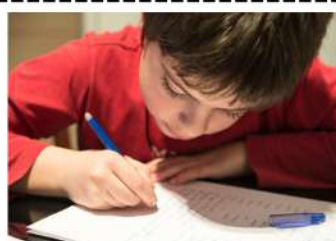
Faire des activités dans un cahier